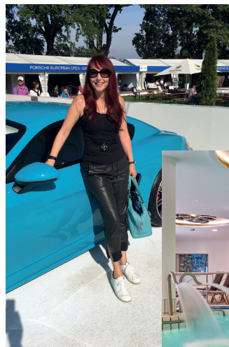
Spa Hartl Quellness & Golf Resort